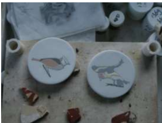
Geglazuurde maar nog niet gebakken tegels van een kuifmees en een puttertje.

Hieronder wat voorbeelden van de eerste serie Majolica's.