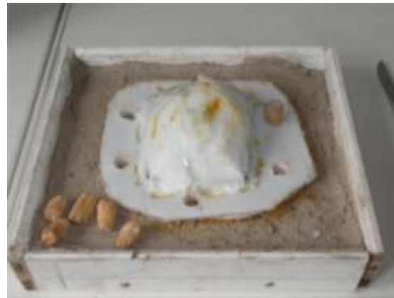
De lockers verwijderd, waarna een gips laag als steunmal wordt gemaakt.