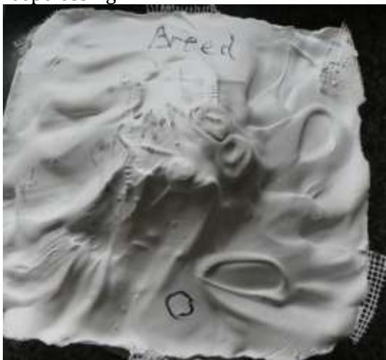
Over de siliconen rubber mal is de gips steunmal gemaakt.