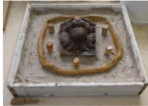
Lockers op de kleilaag gezet.