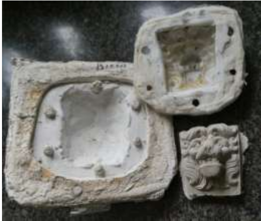
De schoongemaakte mal met de eerste gegoten uitgeharde leeuwenkop.