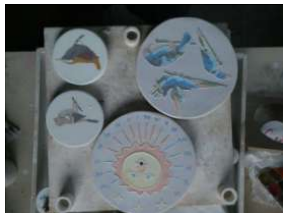
Geglazuurde maar ongebakken tegels van een winterkoninkje, vink, paradijsvogels en een ontwerp voor een zonnwijzer.