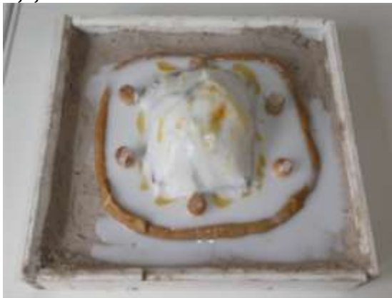
Dunne siliconenrubber gegoten tot aan het dijkje. De scherpe kanten aangesmeerd met dikkere siliconenrubber (siliconenrubber met 3% thixo). Glad gemaakt met een zeeplossing.