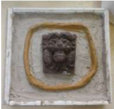
Kistje met kleilaag en daarop het model en een dijkje van bruine klei.

Nu achtereenvolgens wat foto's van het maken van de mal.