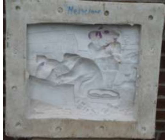
De siliconen rubber mal van de timmerman