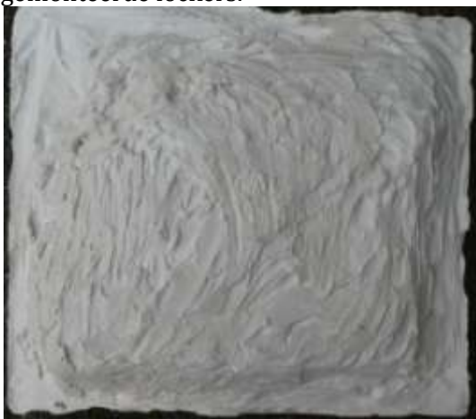
De buitenzijde van de gips steunmal van de timmerman