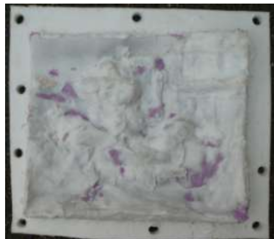
De siliconen rubber mal aan de buitenzijde. De paarse vlekken is gekleurde SR waarmee de scheurtjes in de mal zijn gerepareerd.

Vier van de gegoten gevelstenen zijn hieronder weergegeven.