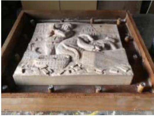
Het bakje met daarin het houtsnijwerk en de gemonteerde lockers.